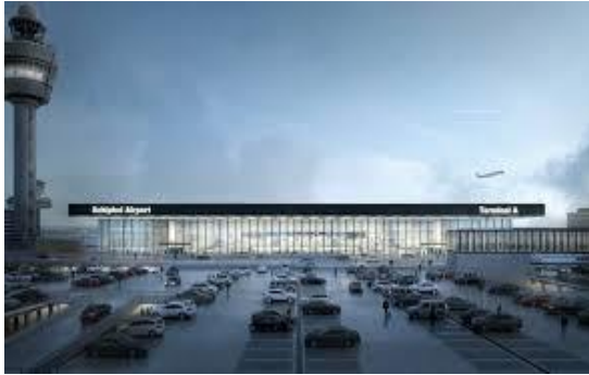
> assetbase + 30-40% in komende 5 jr