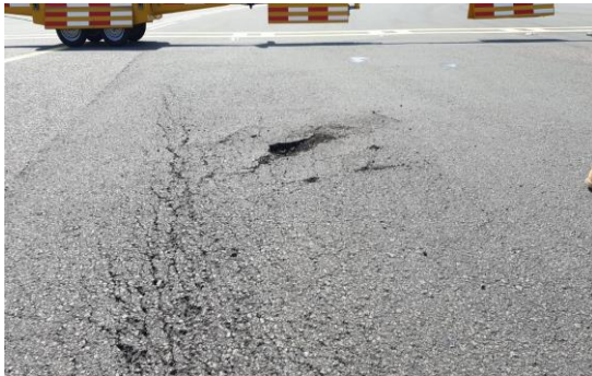
Onderhoud versus nieuw- & verbouw