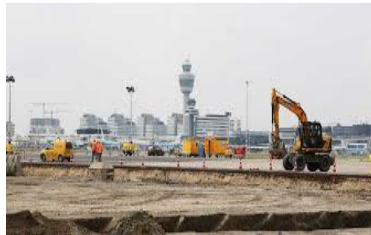
Tekort aan technici