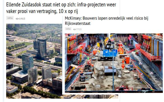
Prijs vs. risico