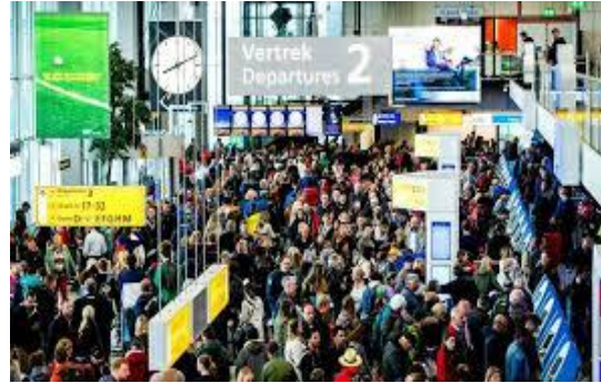
Toename aantallen passagiers